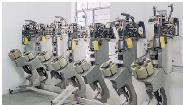
Sistem simulator spindel mesin