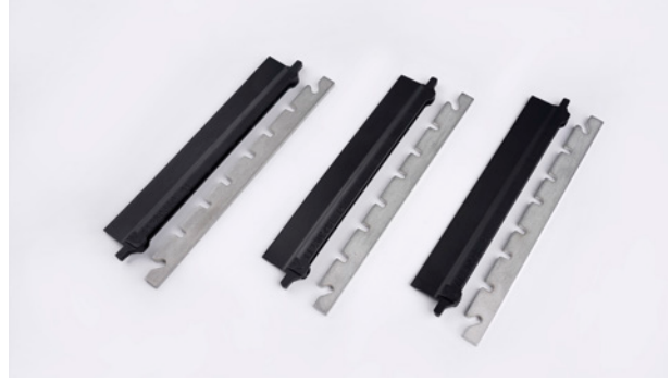
Sökülebilir tutuculu üst temizleme kenarı