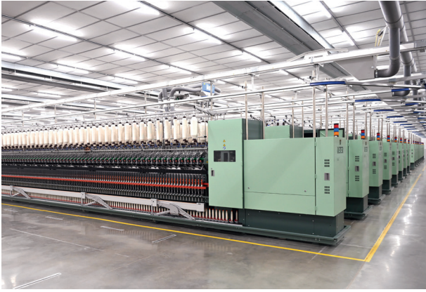
K 47与Autoconer X6直联—挡车工可专注于监控功能。